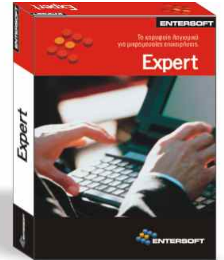
Συνοπτική Εικόνα Επιχείρησης